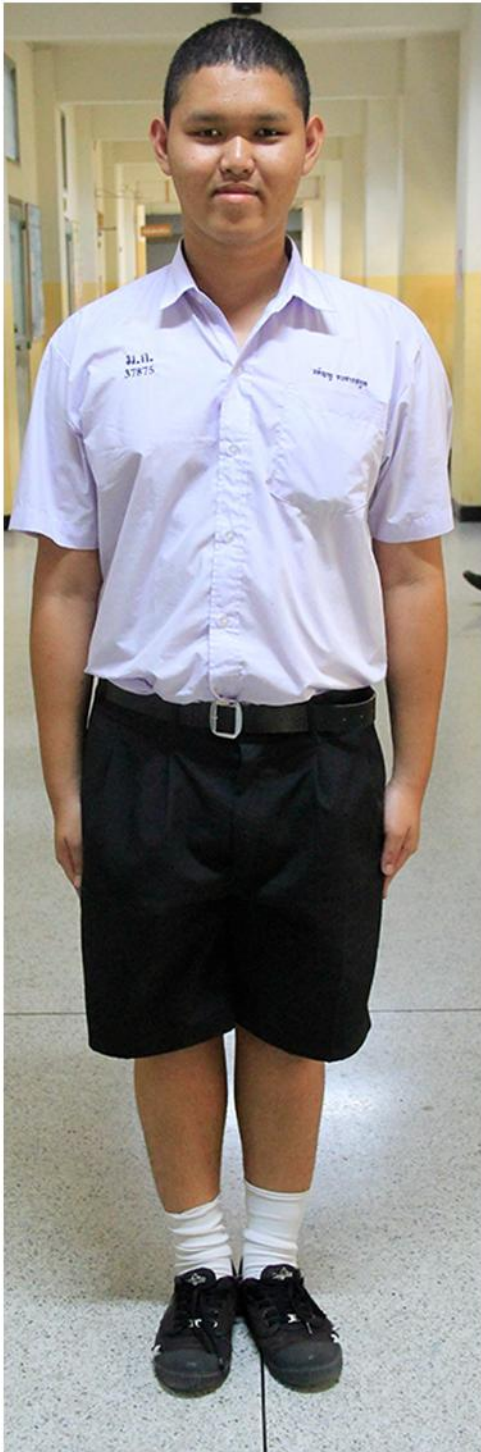
ชุดนักเรียน