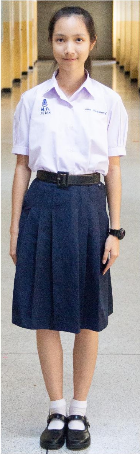
ชุดนักเรียน