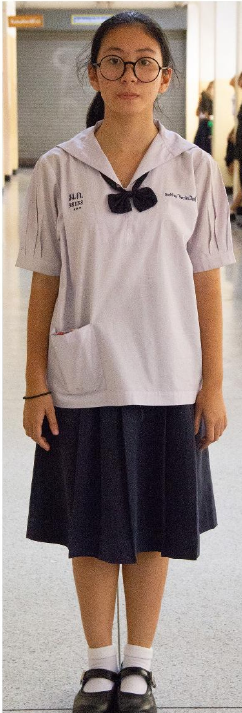
ชุดนักเรียน