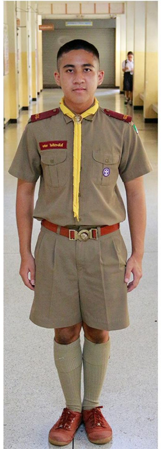
ชุดลูกเสือ