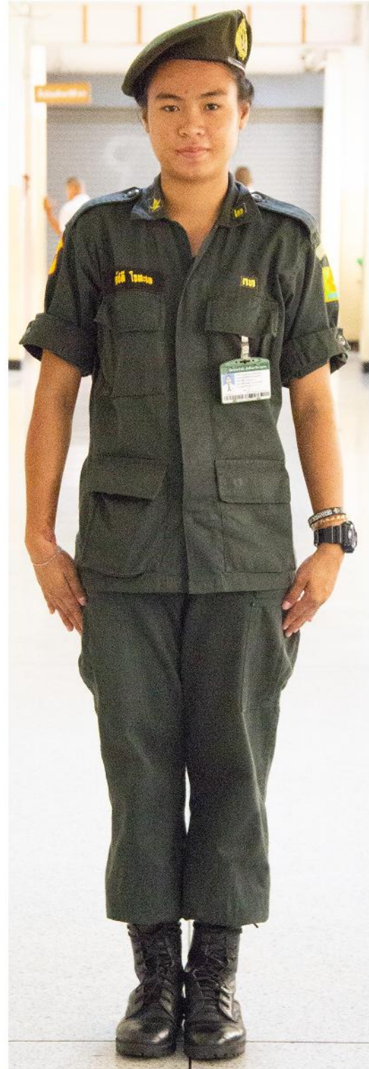
ชุดนักศึกษาวิชาทหาร