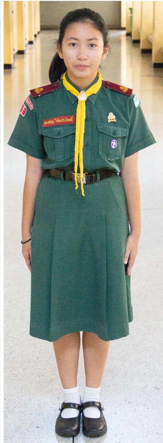
ชุดเนตรนารี