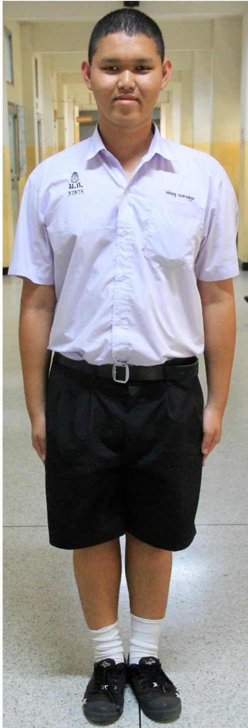
ชุดนักเรียน